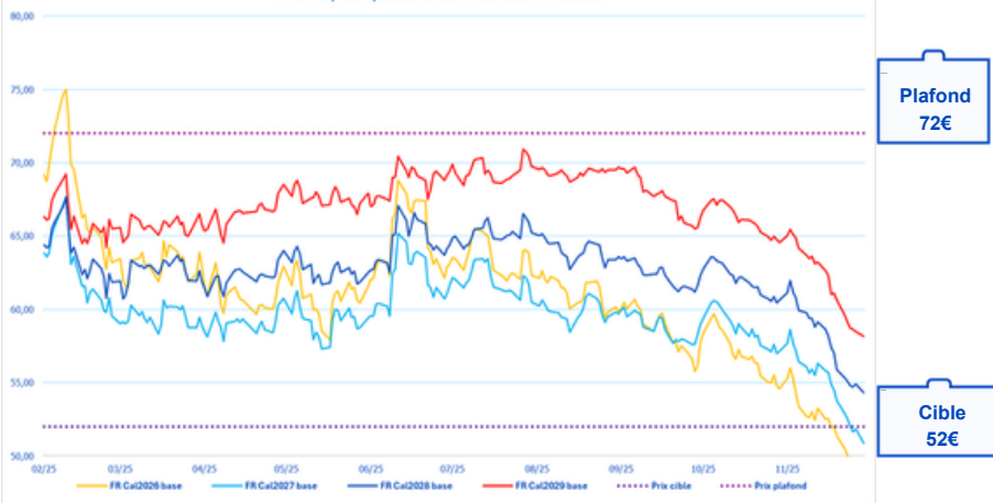
Tunnel de prix d'après le marché au cours de l'année 2025