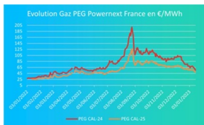
Graphique 1 : évolution du prix du gaz depuis le 01/01/22

Le Groupe Engie sera ravi d'accueillir l'Assemblée Générale de l'ARIA le 13 juin 2023. Ce sera aussi l'occasion de faire le point à mi-année de l'évolution des marchés et leurs perspectives.